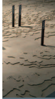
Modell der „KZ-Landschaft“ im Südharz

Die Seminarmodule können auf unterschiedliche Lernvoraussetzungen und Altersstufen zugeschnitten werden.