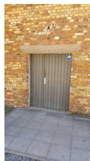
Eingang zum ehemaligen Krematorium

Informationen zu den Exponaten werden schriftlich vermittelt. Es gibt akustische Informationen zu den Exponaten.