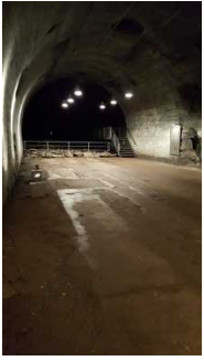
Ausstellung im Stollen