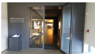
Eingang zur Dauerausstellung