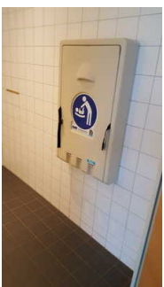
Wickeltisch für Kleinkinder