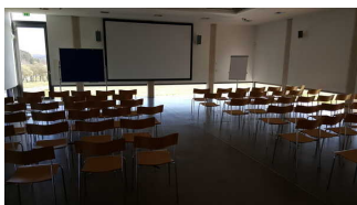
Kino und Veranstaltungssaal