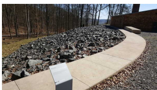
Hinweistafel am ehemaligen Krematorium