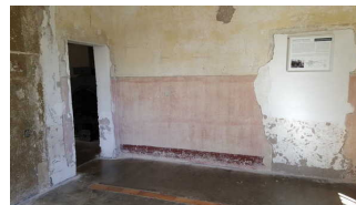
Tür innen im ehemaligen Krematorium