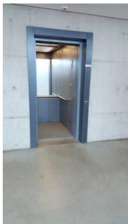
Aufzug im Museumsgebäude