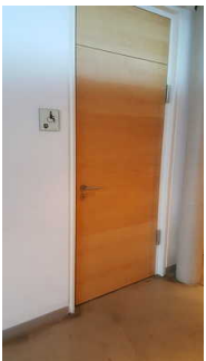
Tür zur Toilette