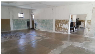
Der Raum ehemaliges Krematorium