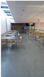
Café im Museum

Es gibt Tische mit heller und blendfreier Beleuchtung.