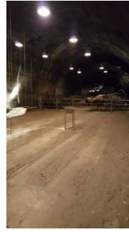
Ausstellung im Stollen