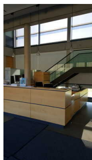
Kasse im Museum