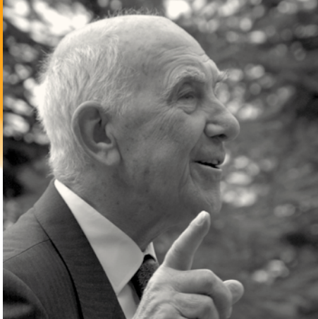
12. April 2005