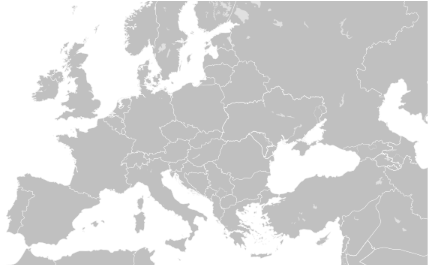
Karte 1: Europa heute

Public Domain, Herkunft: Wikimedia Commons