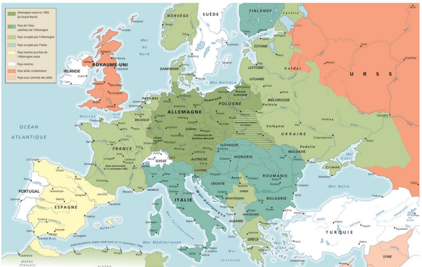
Karte 2: Europa um 1942