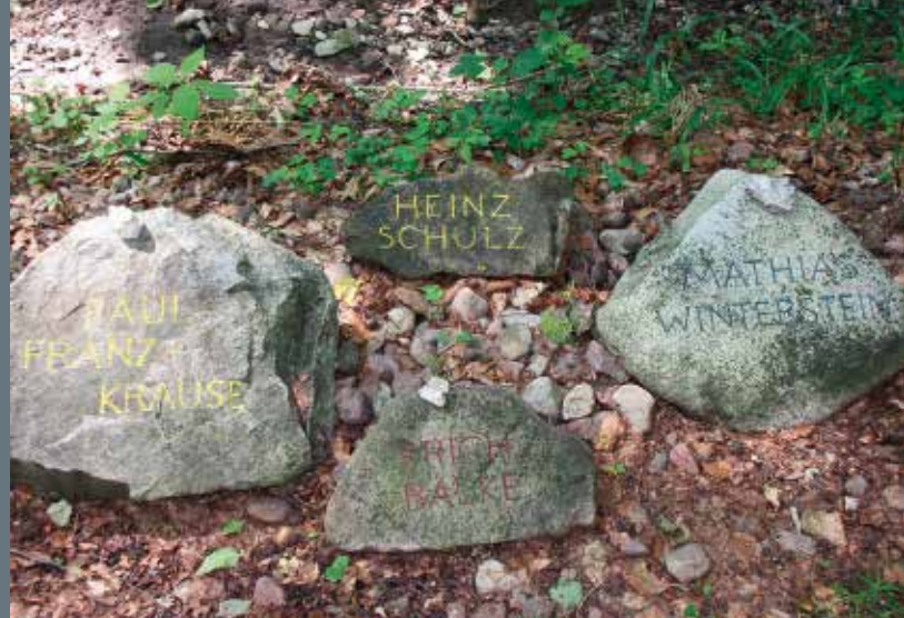
Kamienie poświęcone dzieciom deportowanym do Buchenwaldu