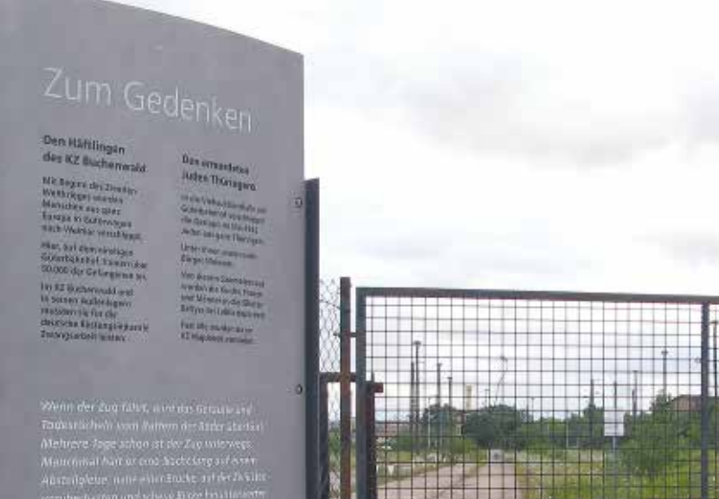
Tablica pamiątkowa przy byłym dworcu towarowym w Weimarze