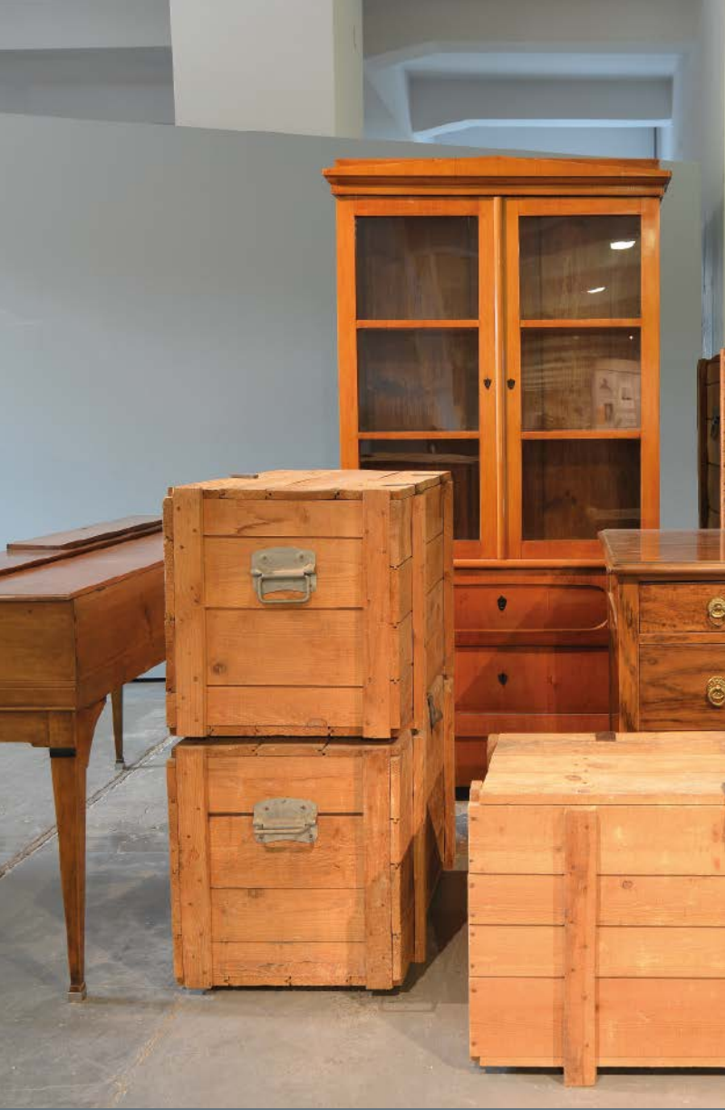
Бухенвальд. Дискримінація та насилля. 1937 – 1945 рр.

Фотографії з нової постійно діючої експозиції про історію концтабору Бухенвальд: зліва – копії меблів Фрідріха Шіллера а також ящики для безпечного транспортування культурних цінностей із музею Гете, виготовлені в'язнями концтабору у майстернях Німецьких збройних заводів (DAW), що належали СС; справа – справжній одяг в'язнів у «Кабінеті реалій», у вітрині «Одяг та уніформа в'язнів».