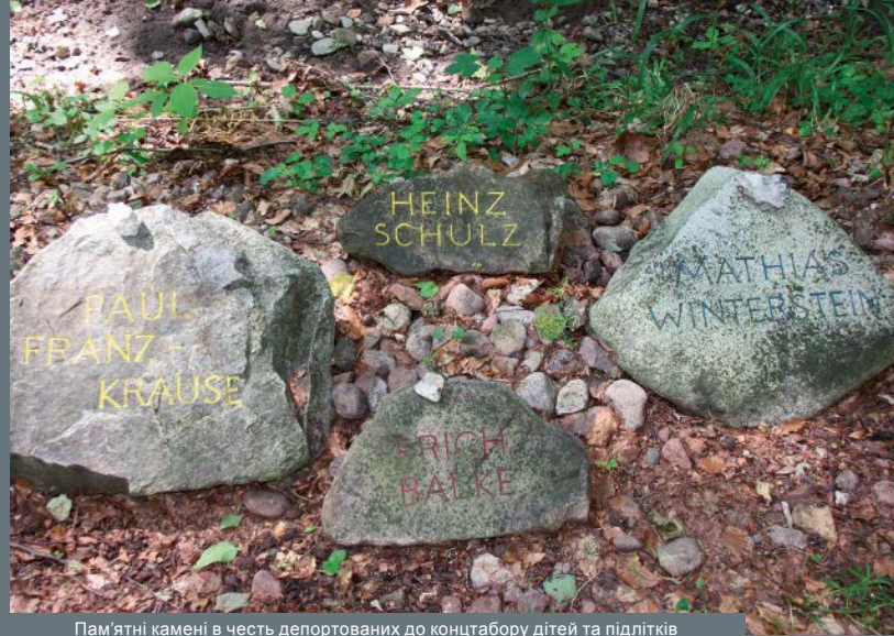
Пам'ятні камені в честь депортованих до концтабору дітей та підлітків