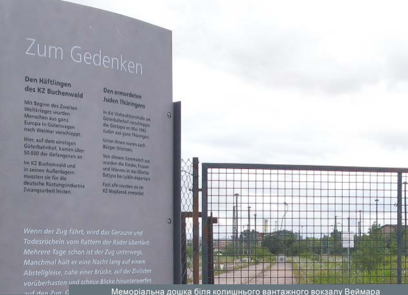
Меморіальна дошка біля колишнього вантажного вокзалу Веймара